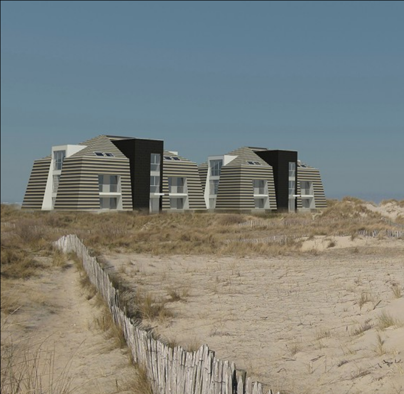
Dit duinenproject in Middelkerke oogt als een verzameling bedoeïenententen en is perfect afgestemd op zijn omgeving