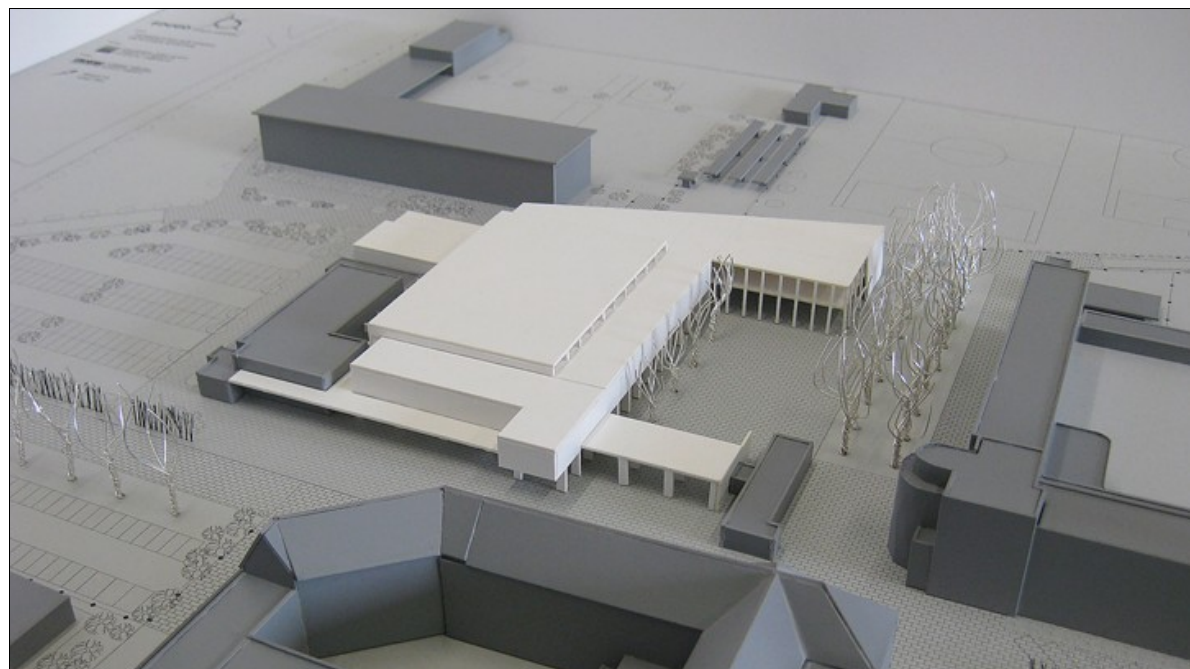
"In idit project maakt de huidige centrale parking plaats voor een sport- en cultuurplein. Tegenover het mooie art-decogebouw en de platanendreef maakt het nieuw complex de pleinwanden af" Maquette: EDUGO Scholengemeenschap (Oostakker)

Zo ontwierp ARKS architecten in opdracht van Koramic Real Estate een industrieel complex van 7500 m 2 . Het ontwerp is het uithangbord van Hain Celestial Europe, pionier in bioproducten op mondiaal vlak. De groep Hain Celestial biedt niet alleen producten aan, maar voert ook een bedrijfspolicy waar respect voor mens en natuur een belangrijke plaats innemen. ARKS architecten vertaalde deze cultuur in een zeer compact gebouw met een flexibele planindeling. Een massief portaal opent het kantoor naar het zuiden en fungeert eveneens als schaduwluifel voor de dieperliggende landschapskantoren. Van op afstand lijkt het gebouw op een uit zijn krachten gegroeide villa. De bekleding met