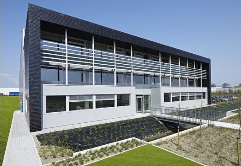
"De groep Hain Celestial voert een bedrijfspolicy waar respect voor mens en natuur een belangrijke plaats innemen. ARKS architecten vertaalde deze cultuur in een zeer compact gebouw met een flexibele planindeling"

Koramic-pannen levert een dynamische schakering van kleuren op en geeft het portaal niet alleen een natuurlijk karakter, maar evenzeer een ijzersterke identiteit. Er werd in het ontwerp gestreefd naar een maximale duurzaamheid door het beperken van de energievraag, het gebruik van hernieuwbare energiebronnen, het toepassen van efficiënte technieken en een bewust materiaalgebruik.